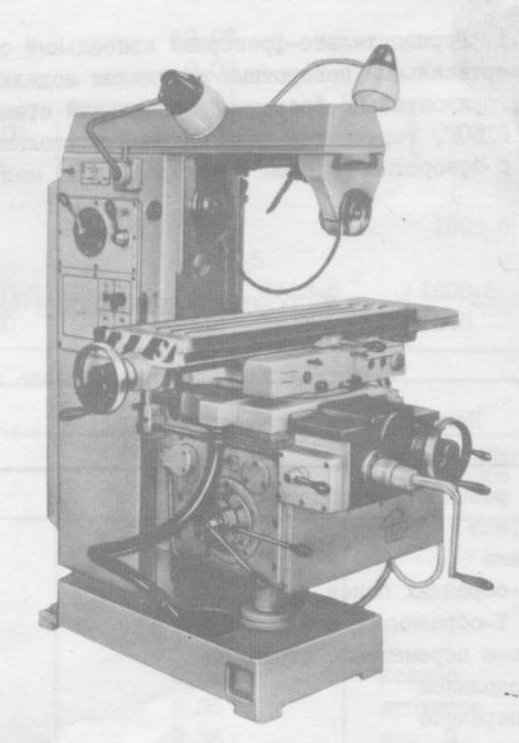
Рис. 2. Станок горизонтально-фрезерный консольный с поворотным столом (универсальный) 6780